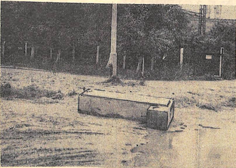
Около цеха № 12 лежит электропечь. А ведь ей давно приготовлено место на утильбазе.